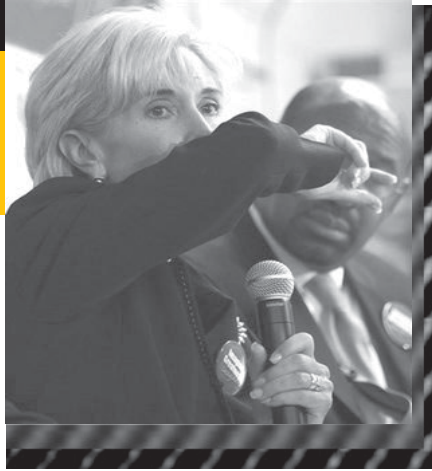
U.S. Health and Human Services Secretary Sebelius mostrando cómo cubrirse al toser

La tos ferina es una enfermedad que puede suceder a cualquier persona, pero los adultos de edad avanzada, los niños, y en especial los bebés puede ser de gravedad. La tos ferina es una enfermedad muy contagiosa causada por un tipo de bacteria llamado Bordetella pertussis. Por lo general, las personas con tos ferina la contagian al toser o estornudar cerca de otras personas, y quienes inhalan la bacteria se enferman.